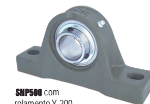
SNP500 com rolamento Y 200 (fixação no eixo por parafusos)