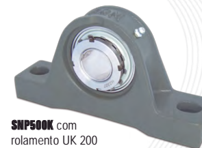
SNP500K com rolamento UK 200 (fixação no eixo por bucha cônica)