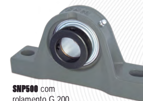
SNP500 com rolamento G 200 (fixação no eixo por colar excêntrico)