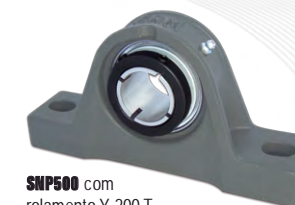
SNP500 com rolamento Y 200 T (fixação no eixo por colar concêntrico)